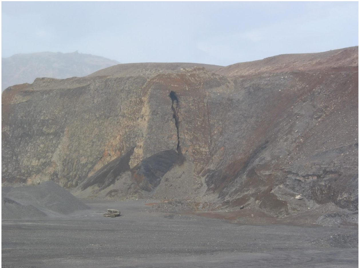
Undirhlíðanáma árið 2007 Helgafell í baksýn.

Í fyrstu vinnsluáætlunum fyrir námuna var gert ráð fyrir að dalurinn sem var á milli Bakhlíða og vesturbrúnar Undirhlíða yrði dýpkaður. Þessi hugmynd var sett fram til þess að náman yrði sem minnst sýnileg og náttúrulegum brotum í landinu fylgt. Þá yrði kjarrivaxin vesturhlíð Undirhlíða með sínum eldvörpum heldur ekki eyðilögð. Þetta hefur að nokkru gengið eftir en náman er orðin full djúp eins og áður segir.